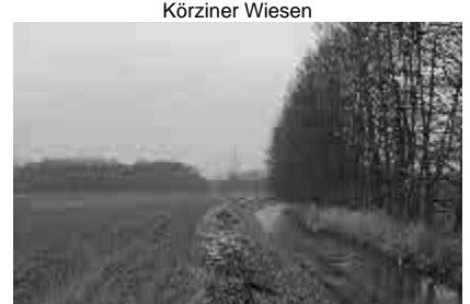
Mühlengraben bei Stücken