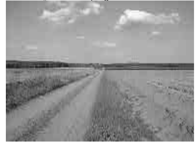
Spargelfelder von Kietz/Schlunkendorf