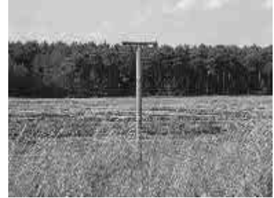
„Hochsitz“ bei Kietz

alle Bilder © Thomas Lenk; 1. Seite: 09.02.2005; 2. Seite: 23.06.2002