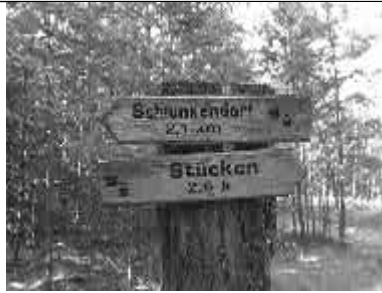
Im Wald von Stücken nach Kietz