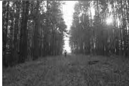
Aufstieg zum Backofenberg