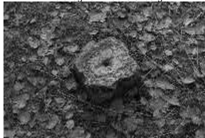
Gipfel des Backofenberges