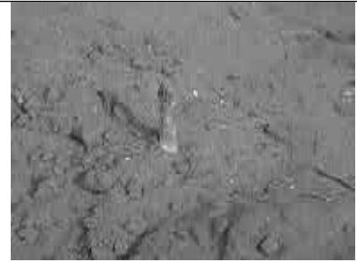
„Beelitzer Spargel“ bei Kietz