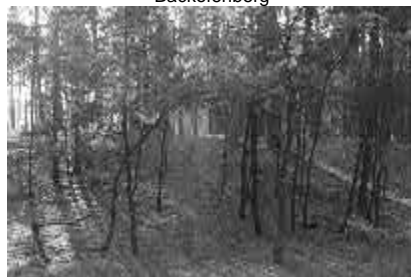
Abstieg vom Backofenberg