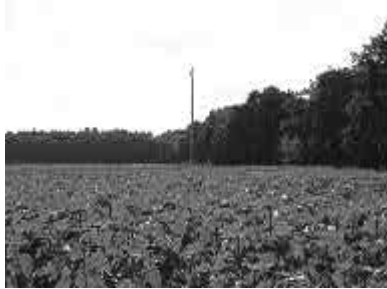
Sonnenblumenfeld westlich von Stücken