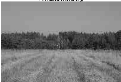
Aufstieg zum Ziebchenberg